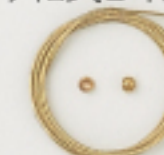
K4545 (ゴールド) 1m入 (40×7) 約0.5mm