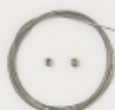
K2323 (クリア) 4m巻 (46×7) 約0.3mm