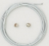
K4548 (白) 1m入 (#49×7×7) 約0.36mm