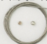
K4546 (シルバー) 1m入 (40×7) 約0.5mm