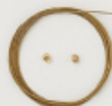
K4540 (ゴールド) 4m巻 (45×7) 約0.3mm