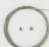
K2324 (クリア) 4m巻 (44×7) 約0.36mm