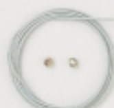
K4561 (白) 4m巻 (43×7) 約0.45mm