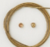
K4543 (ゴールド) 4m巻 (40×7) 約0.5mm