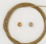
K4541 (ゴールド) 4m巻 (42×7) 約0.4mm