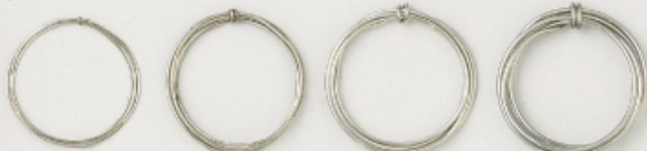
H4461 8m巻 #28 (0.35mm)

曲げやすく、適度な硬さがあるので造形作品の制作に最適です。 ※ご注文は種類(コードNo.)とカラーを明記下さい。 (例)H4461/#1