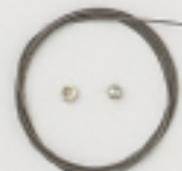
K4547 (クリア) 1m入 (#49×7×7) 約0.36mm