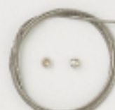
K2326 (クリア) 4m巻 (40×7) 約0.6mm