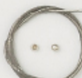
K2327 (クリア) 4m巻 (38×7) 約0.7mm