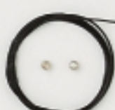
K4563 (黒) 4m巻 (43×7) 約0.45mm