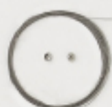
K4555 (クリア) 4m巻 (48×7) 約0.2mm