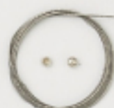
K2325 (クリア) 4m巻 (42×7) 約0.4mm