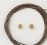
K4564 (ブロンズ) 4m巻 (43×7) 約0.45mm