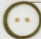
K4550 (オリーブゴールド) 1m入 (#49×7×7) 約0.36mm