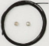
K4549 (黒) 1m入 (#49×7×7) 約0.36mm