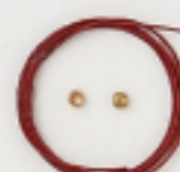
K4562 (赤) 4m巻 (43×7) 約0.45mm