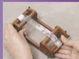
シートを巻き取る。