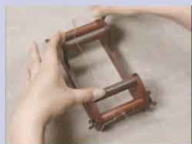
止め棒を使うタテ糸の張り方