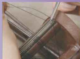
ストッパーを使う糸の張り方