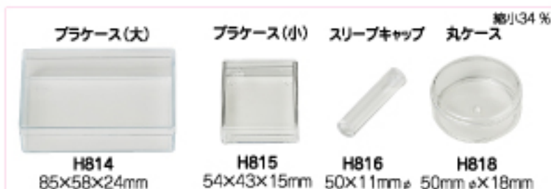
縮小34% ブラケース(大) H814 85×58×24mm ブラケース(小) H815 54×43×15mm スリーブキャップ H816 50×11mmφ 丸ケース H818 50mm φ×18mm