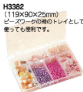
H3382 (119×90×25mm) ビーズワークの時のトレイとして 使っても便利です。