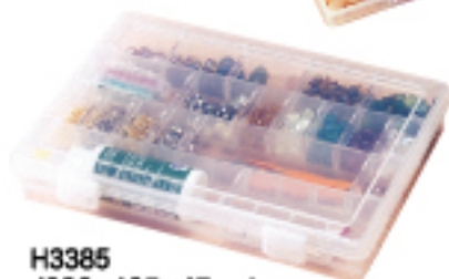
H3385 (286×195×47mm) 仕切板24枚付