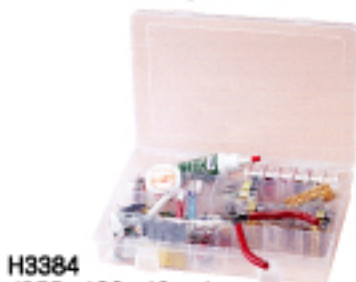
H3384 (255×190×40mm) 仕切板20枚付