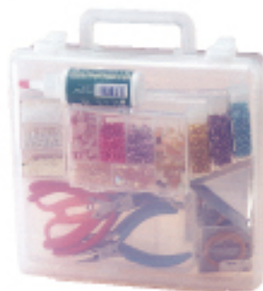
H3386 (255×250×77mm) このケースひとつで ビーズ工具類等 すべてが収納できます。