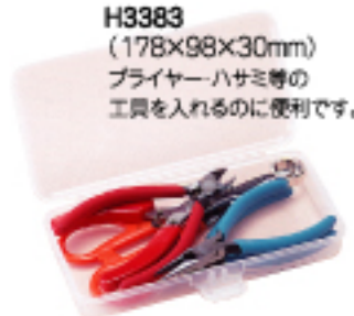
H3383 (178×98×30mm) プライヤー・ハサミ等の 工具を入れるのに便利です。