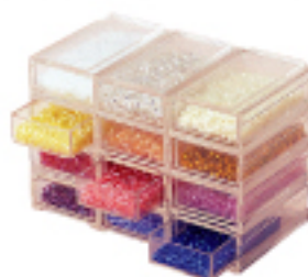
H3387 (28×44×15mm/1ケース) 1ユニット12ケース付 ビーズケース "Beads Hut" ケースはジョイント式ですので とても便利です。