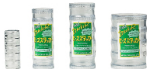
H4546 30mm 5段 H3378 40mm 6段 H3379 50mm 5段 H3380 70mm 4段