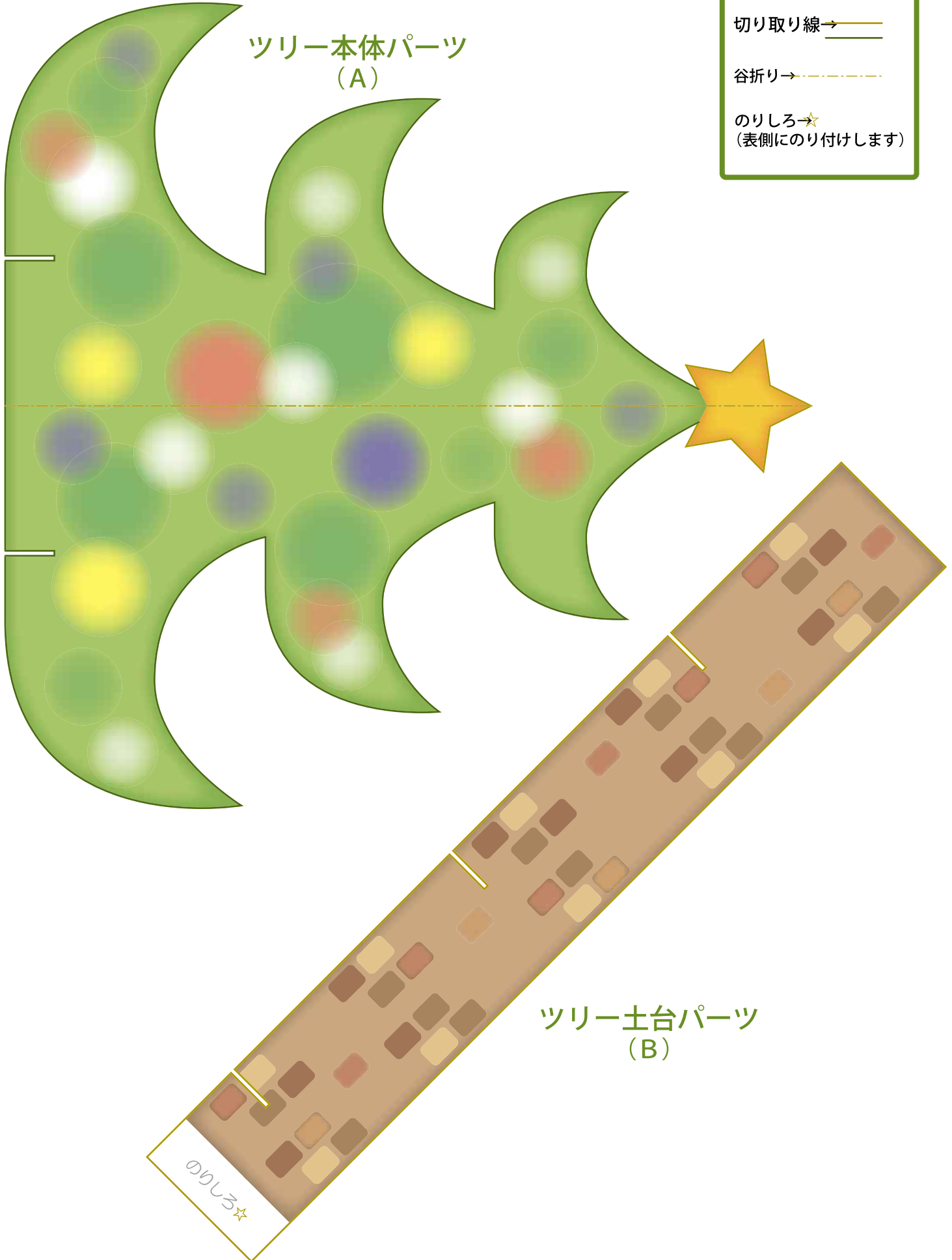
ツリー土台パーツ (B)