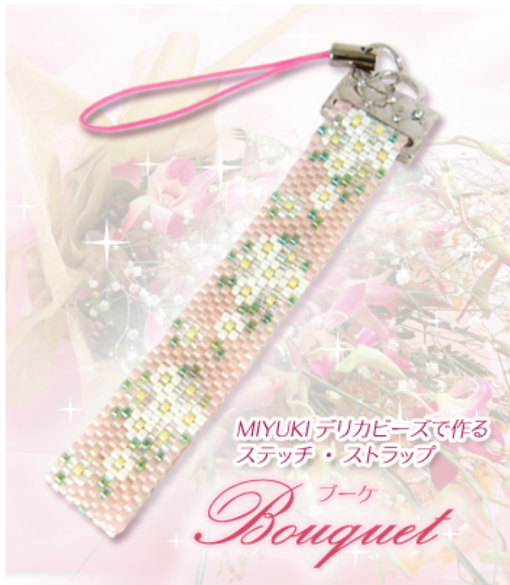
MIYUKI デリカビーズで作る ステッチ・ストラップ