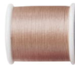
#4 うす茶 JANコード： 4992403 126011