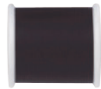
#12 黒 JANコード： 4992403 126028