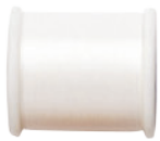
#2 アイボリー JANコード： 4992403 125991