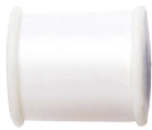
#1 白 JANコード： 4992403 125984