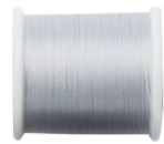
#3 グレー JANコード： 4992403 126004